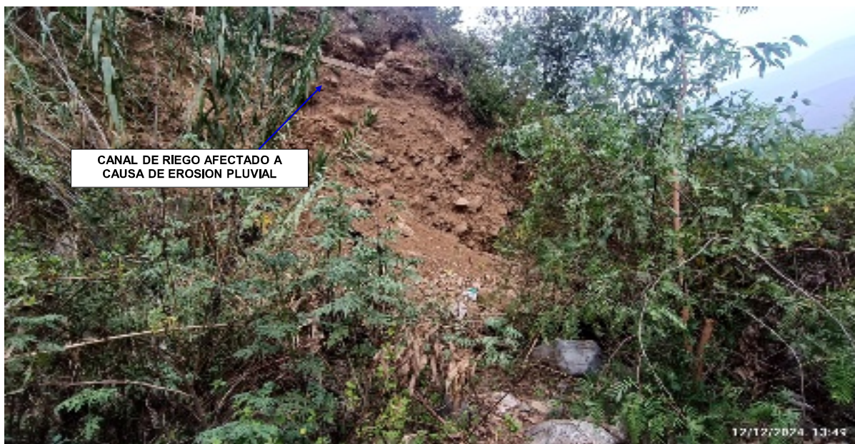
FIGURA N°04: EL CAUCE DE LA QUEBRADA SE ENCUENTRA EN LA MARGEN IZQUIERDA, CON SOCAVACIÓN, PONIENDO EN RIESGO AL CANAL DE RIEGO QUE ATIENDE A MAS DE 9.50 HA DE AREAS DE CULTIVO DE LOS POBLADORES DEL ANEXO CUCAPUNCO DE LA COMUNIDAD CAMPESINA DE SUMBILCA.