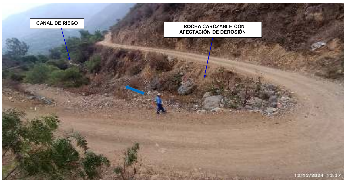
FIGURA N°03: TRAMO DE LA QUEBRADA INQUIRUHUY SE ENCUENTRA COLMATADO CON MATERIAL FLUJO DE DETRITOS Y ROCAS, CON AFECTACION A LA TROCHA Y EN CANAL DE RIEGO QUE CRUZA LA QUEBRADA.