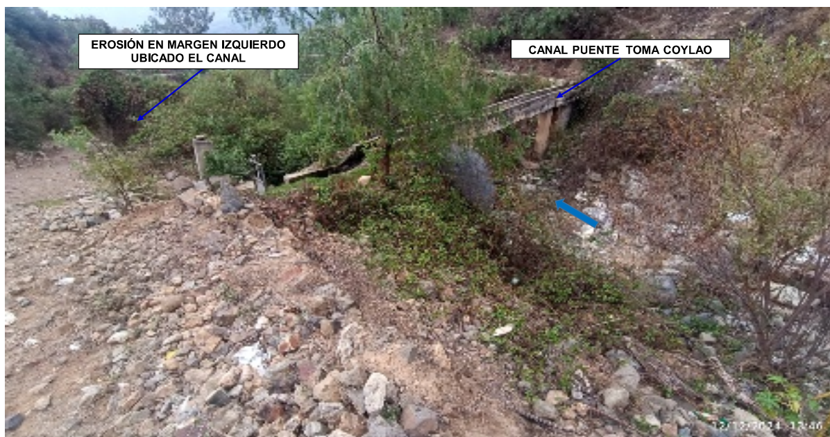
FIGURA N°01: UBICACION DE LA QUEBRADA INQUIRUHUY QUE SE ENCUENTRA COLMATADO A LA ALTURA DEL CRUCE DE LA TROCHA CARROZABLE CUCAPUNCO - PISCOCOTO, DISTRITO DE SUMBILCA, PROVINCIA DE HUARAL - LIMA.