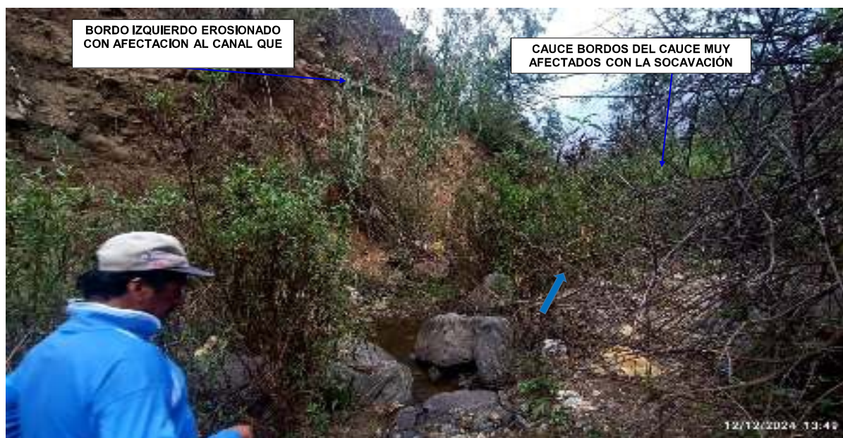
FIGURA N°02: CAUCE COLMATADO CON FLUJO DE DETRITOS Y ROCAS DE DIFERENTES TAMAÑOS, BORDO MARGEN IZQUIERDA SE ENCUENTRA EROSIONADO POR EL CAUDAL EN TIEMPOS DE AVENIDAS PONIENDO EN POLIGRO A COLAPSO DEL CANAL DE RIEGO TOMA COYLLO.