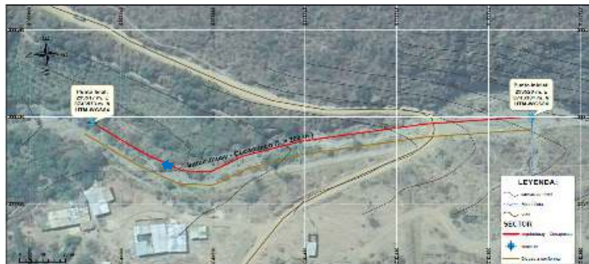
5.- IMAGEN SATELITAL DE ZONA VULNERABLE